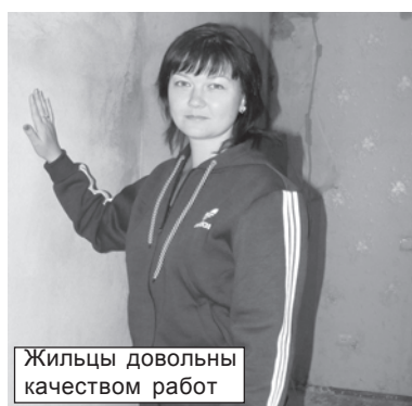
Жильцы довольны качеством работ

На заседании комиссии по чрезвычайным ситуациям состоялся серьезный разговор о том, что в городе есть квартиры, где люди проживают, нарушая нормы поведения и общественный порядок.